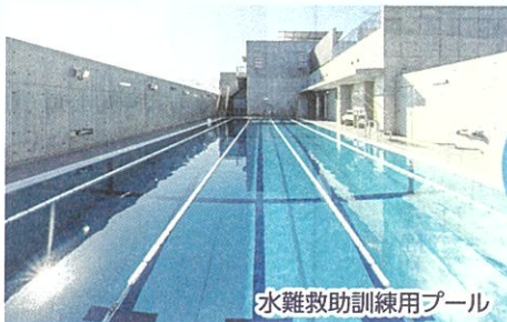
水難救助訓練用プール