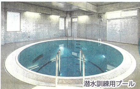
潜水訓練用プール