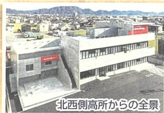
北西側高所からの全景